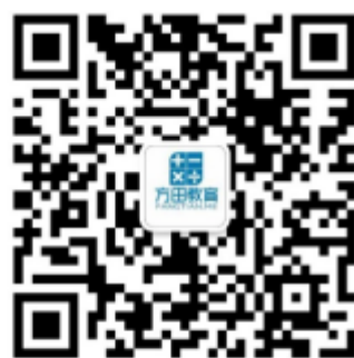
方田教育 hr 汤老师微信

扫描二维码加 HR 微信, 进入方田就业交流群, 按要求更改群名片后, 想要了解方田或者对于就业有任何问题, HR 随时帮你答疑解惑! 关注方田教育校招公众号,