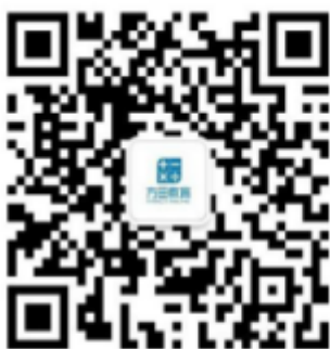
方田教育校招微信公众号

方田宣讲会现场有各种福利活动, 到场就有礼品, iPad、小米音箱、小米手环等各种大奖等你来拿!